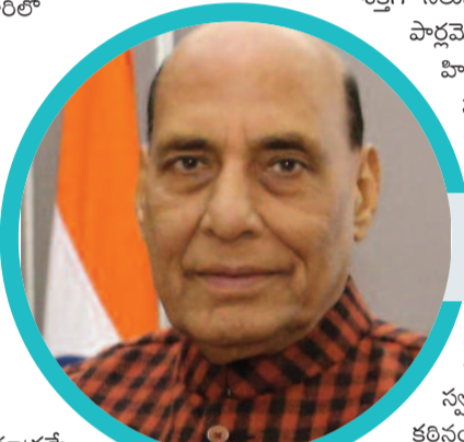
వ్యాసకర్త రాజ్ నాథ్ సింగ్, కేంద్ర రక్షణ శాఖ మంత్రి

గత మూడు శతాబ్దాలలో భారతదేశ చైత్ర మేల్కొలుపులో బెంగాల్ కేవలం భాగస్వామిగా మాత్రమే లేదు... ఆ ఉద్యమానికి ఒక మూలస్రంభంగా నిలిచింది. ఆనాటి పరిస్థితులను చూసిన రాజా రామోచంద్ రావు... అప్పటి సమాజం ఆచార వ్యవహారాల విషయంలో ఎంతో కఠినంగా, అవినీతిమయంగా తయారైందని గమనించారు. ఆయన సంప్రదాయాన్ని పదులుకోలేదు... అలాగని దానికి గుడ్డిగా లొంగిపోనూ లేదు. సతీసహజమగు సీషేధం కోసం పోరాడటం, అంతర్గత మధనం ద్వారా