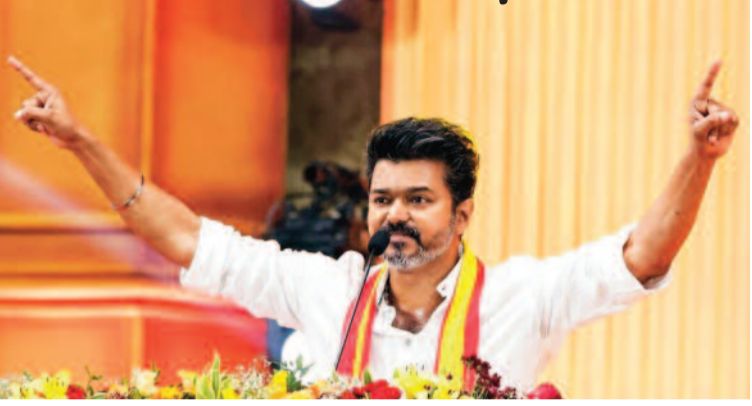
ఎట్టకేలకు తమిళనాడు ప్రభుత్వ ఏర్పాటుపై అనిశ్చితి వీడింది. అత్యధిక స్థానాలు గెలిచిన విజయ్ నేతృత్వంలోని టీవీకేకు కాంగ్రెస్, వామపక్షాలు, వీసీకే, బయూఎంఎల్ మద్దతు తెలపడంతో ప్రభుత్వం ఏర్పాటుకు గవర్నర్ రాజీంద్ర విశ్వనాథ్ అర్డర్ లైన్ క్లియర్ చేశారు. ఈ మేరకు తమిళనాడు ముఖ్యమంత్రిగా విజయ్ ను నియమిస్తూ లోక్ సభను ఓ ప్రకటన విడుదల చేసింది.