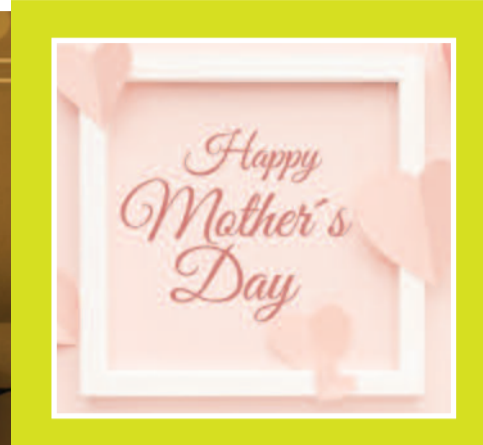
(నేడు మాతృ దినోత్సవం)

ప్రపంచంలో ప్రతి మనిషి మొదట పలికే పదం 'అమ్మ'. ఆ ఒక్క పదంలోనే ప్రేమ ఉంది, త్యాగం ఉంది, ఆప్యాయత ఉంది, ఆరాధన ఉంది. మాతృదినోత్సవం అనేది కేవలం ఒక ప్రత్యేక రోజు మాత్రమే కాదు.. అమ్మ అనే మహోన్నతమైన వ్యక్తిత్వాన్ని గుర్తు చేసుకునే సందర్భం. నేటి వేగవంతమైన, యాంత్రిక జీవితంలో అమ్మ పాత్ర ఎంత గొప్పదో మరోసారి ఆలోచించాల్సిన అవసరం ఉంది.