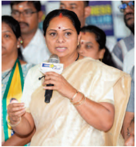
హైదరాబాద్ లో దాదాపు 50 నుంచి 120 శాతం వరకు ఫీజులు పెంచుతున్నారని మండిపడ్డారు. ఈ విషయంలో ప్రభుత్వం వెంటనే స్పందించకపోతే పెద్ద ఎత్తున ఉద్యమం తప్పదని హెచ్చరించారు. త్వరలోనే తమతో కలిసి వచ్చే అన్ని రాజకీయ పార్టీలను కలుపుకొని కలెక్షన్ల వద్ద ఆందోళన చేస్తామని చెప్పారు. తాము కొత్తగా ఏమీ అడగటం లేదని...రేవంత్ రెడ్డి సర్కార్ గతంలో ఇచ్చిన హామీలనే అడుగుతున్నామన్నారు.

హైదరాబాద్, మే 6 (ఈవార్తలు): రాష్ట్రంలో ప్రైవేట్ విద్యాసంస్థల దోపిడీని అరికట్టటంలో రేవంత్ రెడ్డి సర్కార్ ఘోరంగా ఫెయిల్ అయ్యారంటూ తెలంగాణ రక్షణ సేన (టీఆర్ఎస్) వీఫ్ కవిత ఆరోపించారు. ఫీజుల దోపిడీ నియంత్రణకు ఈ నెలలోనే చట్టం తేవాలని ఆమె డిమాండ్ చేశారు. హైదరాబాద్ పేరెంట్స్ అసోసియేషన్ ఆధ్వర్యంలో నాణ్యమైన విద్య - ఫీజుల నియంత్రణ అనే అంశంపై సోమజూరూర్ ప్రెస్ క్లబ్ లో జరిగిన రౌండ్ టేబుల్ సమావేశం లో ఆమె పాల్గొన్నారు. ప్రైవేట్ విద్యాసంస్థల దోపిడీ, హైదరాబాద్ పబ్లిక్ స్కూల్ లో అవినీతి పై ప్రభుత్వం స్పందించాలని కోరారు. ఫీజు నియంత్రణ చట్టాన్ని తుంగలో తొక్కే కుట్రలను వెంటనే మానుకోవాలని డిమాండ్ చేశారు. ప్రైవేట్ విద్యాసంస్థల దోపిడీని నియంత్రించాల్సిన ముఖ్యమంత్రి ప్రైవేట్ విద్య సంస్థల ప్రారంభోత్సవాలకు వెళ్తూ వారిని ఎంకర్లేజీ చేస్తున్నారని మండిపడ్డారు. ముఖ్యమంత్రి మన విద్యాశాఖ మంత్రి కావటం ఖర్చు అని ఆవేదన వ్యక్తం చేశారు.