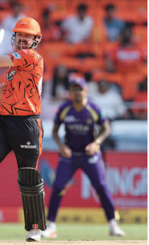
సన్రైజర్స్ కు షాక్