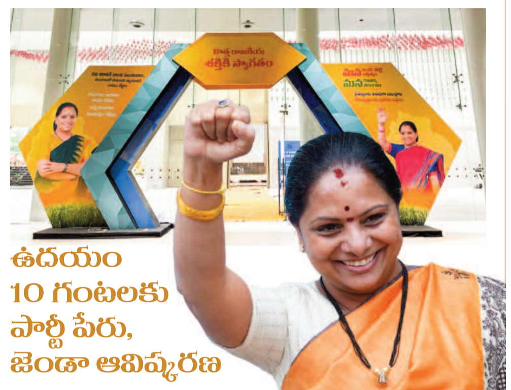
ఉదయం 10 గంటలకు పార్టీ పేరు, జెండా ఆవిష్కరణ