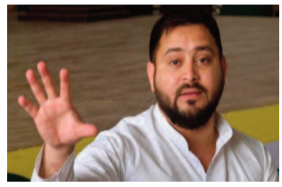
నాయకుడిగా నితీశ్ కుమార్ ఉంటారని బీజేపీ పలుమార్లు చెప్పిందని, కానీ ఇప్పుడు ఆయనను రాజకీయంగా అంతం చేసిందని మండిపడ్డారు. ఏ రాష్ట్రానికైనా రాజకీయ స్థిరత్వం అవసరమని, బీహార్ లో అది కారపడిందని అన్నారు. బెడోళ్లలో ఐదు ప్రభుత్వాల మారాయని వ్యాఖ్యానించారు.

పాట్నా: జేడీ(యూ) అధినేత నితీశ్ కుమార్ ను రాజకీయంగా అంతం చేయాలనుకుని లక్ష్యంగా పెట్టుకున్న బీజేపీ, ఆయనపై ఒత్తిడి తెచ్చి బీహార్ ముఖ్యమంత్రి పదవికి రాజీనామా చేయించిందని ఆరోపిస్తోంది. ప్రిన్సిపల్ తేజస్వీ యాదవ్ ఆరోపించారు. బీజేపీ నాయకుడు సామ్రాట్ చౌదరి నేతృత్వంలోని కొత్త ప్రభుత్వం తన బలాన్ని నిరూపించుకోవడానికి ప్రత్యేక అసెంబ్లీ సమావేశాన్ని ఏర్పాటు చేసింది. విశ్వాస తీర్మానంపై చర్చ సందర్భంగా ప్రతిపక్ష నాయకుడు తేజస్వీ యాదవ్ మాట్లాడుతూ, నితీశ్ కుమార్ తో బీజేపీ బలవంతంగా ముఖ్యమంత్రి పదవికి రాజీనామా చేయించిందని ఆరోపించారు. 2030 వరకు బీహార్ లో ఎన్డీయే