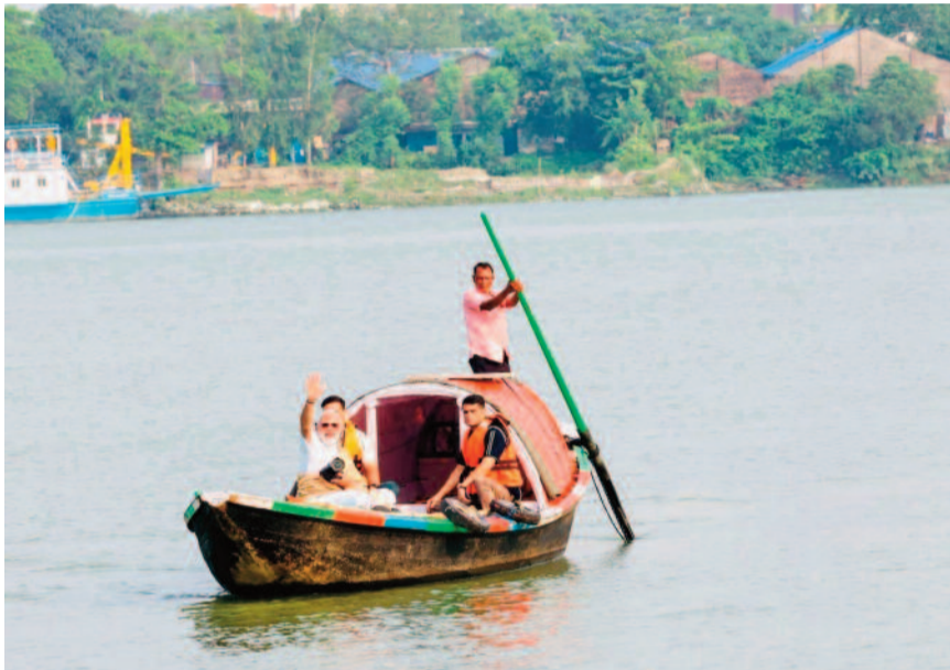
బెంగాల్ అభివృద్ధికి, ప్రజల శ్రేయస్సు కోసం కృషి చేస్తుందని అన్నారు. హుగ్లీ నది ఒడ్డున తాను వెచ్చించిన సమయం చాలా ప్రత్యేకమైనదని మోదీ మరో పోస్టులో పేర్కొన్నారు. చారిత్రాత్మక విద్యాసాగర సేతు, బారా వంతెనను దగ్గరగా చూడటం ఆనందంగా ఉందని పేర్కొన్నారు

అని విమర్శించారు. బెంగాల్ లో మహిళలకు గౌరవం, భద్రత, సాధికారత కల్పించడమే తమ లక్ష్యమని అన్నారు. హుగ్లీ నదిలో మోదీ పడవ ప్రయాణం ప్రధానమంత్రి మోదీ శుక్రవారం ఉదయం కోల్కతాలోని హుగ్లీ నదిలో పడవ ప్రయాణం చేశారు. పడవ నడిపేవారితో, మార్లింగ్ వాక్ చేసే వారితో ఆయన కాసేపు ముచ్చటించారు. ఇందుకు సంబంధించిన ఫోటోలను ఆయన సామాజిక మాధ్యమాలలో పంచుకున్నారు. హుగ్లీ నదిలో బోట్ రైడ్ చేసిన మోదీ, కెమెరా చేతబట్టి నది అంచాలను క్షీణింపించారు. హుగ్లీ నది బెంగాల్ సంస్కృతిలో ముడిపడి ఉందని మోదీ పేర్కొన్నారు. బెంగాలిల జీవితాల్లో గంగానదికి ప్రత్యేక స్థానం ఉందని, దాని జలాలు ఒక ప్రాచీన నాగరికత స్ఫూర్తిని మోసుకు వెళ్తున్నాయని పేర్కొన్నారు. ఈరోజు ఉదయం కొద్దిసేపు హుగ్లీ నది తీరంలో గడిపినట్లు పేర్కొన్నారు. పడవ నడిపే వారితో, ఉదయపు నడకకు వచ్చిన వారితో కాసేపు ముచ్చటించినట్లు తెలిపారు. పడవ నడిపేవారి క్రామిక శక్తిని మోదీ ప్రశంసించారు. ఎన్నికల్లో బీజేపీని గెలిపిస్తే తమ ప్రభుత్వం పశ్చిమ