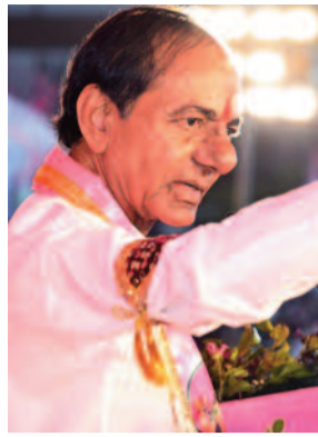
పార్టీకి రాజకీయ లబ్ధి చేకూరుతుందని భావిస్తుండగా, కేసీఆర్ మాత్రం హైద్రా మరియు మూసీ ప్రాజెక్టు వల్ల ఏర్పడిన ప్రజా వ్యతిరేకతను ఏకీకృతం చేసి, మూడు ప్రాంతాల్లోనూ బీఆర్ఎస్ పట్టు నిలుపుకోవాలని చూస్తున్నారు. మూసీ ప్రక్షాళన పేరుతో వేలాది ఇళ్లను తొలగిస్తామన్న ప్రభుత్వ ప్రకటనపై తీవ్ర నిరసనలు వ్యక్తమవుతున్నాయి. ఈ ప్రాంతాల్లోని పేద, మధ్యతరగతి ప్రజలకు కేసీఆర్ అండగా నిలవడం ద్వారా, కాంగ్రెస్ కు పట్టున్న పాతబట్టి సరిపాద్యం మరియు ఇతర కీలక డివిజన్లలో చీలిక తెచ్చే అవకాశం ఉంది. నగర రాజకీయాల్లో ఎంబిఎం పాత్ర కీలకం. ఒకవేళ

ఆవేదన వ్యక్తం చేశారు. చదువుకునే పిల్లల పుస్తకాలు కూడా తీసుకోవనివ్వకుండా ఇళ్లను కూల్చడం ఏ రకమైన పాలన అని ప్రశ్నించారు. జీహెచ్ఎంసీ పరిధిలో హైద్రా చర్యలు గందరగోళం సృష్టిస్తున్న తరుణంలో, ఆ ప్రభావం రాజీయే నగరపాలక ఎన్నికలపై స్పష్టంగా ఉంటుందని బీఆర్ఎస్ భావిస్తోంది. ఈ అసంతృప్తిని తమకు అనుకూలంగా మార్చుకోవడమే కేసీఆర్ లక్ష్యంగా కనిపిస్తోంది. హైదరాబాద్ నగర శివార్లలో, చెరువుల పరివాహక ప్రాంతాల్లో మధ్యతరగతి, ఎగువ మధ్యతరగతి ప్రజలు కొనుగోలు చేసిన ఇళ్లు ఇప్పుడు హైద్రా గుప్పిట్లో ఉన్నాయి. కూల్చివేతల భయంతో ఉన్న ఈ వర్గాలను ప్రసన్నం చేసుకోవడం ద్వారా, గత ఎన్నికల్లో కోల్పోయిన నగర పట్టును తిరిగి సాధించాలని కేసీఆర్ భావిస్తున్నారు. ప్రస్తుత కాంగ్రెస్ ప్రభుత్వం జీహెచ్ఎంసీని మూడు కార్పొరేషన్లుగా (హైదరాబాద్, సైబరాబాద్, మల్లాజిరిగి) విభజించే దిశగా అడుగులు వేస్తోంది. ఈ విభజన వల్ల అధికార