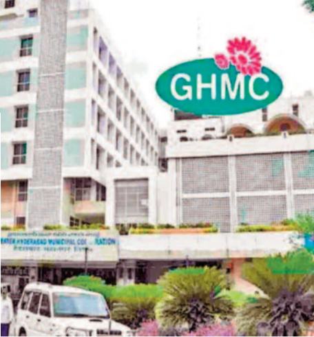
కాంగ్రెస్-ఎంబిఎం డోస్టీ బలపడితే, దాన్ని ఎదుర్కోవడానికి కేసీఆర్ 'హైద్రా బాధితుల పక్షపాతి'గా ముద్ర వేసుకోవడం ద్వారా ఒక కొత్త సమాజిక సమీకరణాన్ని సృష్టిస్తున్నారు. కూల్చివేతలు, అక్రమణల విషయంలో సాధారణంగా బీజేపీ చేసే పోరాటాలను కేసీఆర్ తన భుజానికెత్తుకోవడం ద్వారా, నగరంలో ప్రధాన ప్రతిపక్ష పాత్రను బీఆర్ఎస్ మాత్రమే పోషించగలదని సంతోషిస్తున్నారు. ఇది నగరంలోని ఛోడీంగ్ ఓటర్లను ప్రభావితం చేసే అవకాశం ఉంది. మూడే మంత్రి జీవన్ రెడ్డి వంటి సీనియర్ నేతలు పార్టీలో చేరడంతో ఉత్తర తెలంగాణలో పట్టు పెంచుకుంటూనే, రాష్ట్రవ్యాప్తంగా ప్రభుత్వ వ్యతిరేకతను కూడగట్టేందుకు ఈ సభను ఒక వేదికగా మలుచుకున్నారు. ప్రభుత్వ పథకాలైన రైతు బంధు, దళిత బంధు నిలిపివేతను ప్రస్తావిస్తూనే, హైద్రాను లక్ష్యంగా చేసుకోవడం ద్వారా కేసీఆర్ తన రాజకీయ పునరాగమనాన్ని పక్కా ప్రజాభివృద్ధి చాటుకున్నారు. ఒకవైపు నగర ఓటర్లను, మరోవైపు సామాన్య వర్గాలను ఆకర్షించడమే ఈ 'తొలి సంతకం' హామీ వెనుక ఉన్న అసలు రహస్యం. మరి ఈ ఛూసాం జీహెచ్ఎంసీ ఎన్నికల్లో ఏ మేరకు ఫలిస్తుందో చూడాలి.