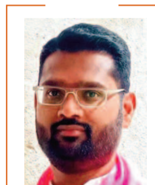
నదీన్ పాసుల జీఆర్ఎస్ సీనియర్ నాయకుడు

తెలంగాణలో 'ప్రజా పాలన' పేరుతో గడ్డెక్కిన రేవంత్ సర్కార్, ఆచరణలో మాత్రం ఆర్కాటాలకే పరిమితమవుతోంది. ప్రచారాల కోసం వేల కోట్లు కుమ్మరిస్తున్న ప్రభుత్వం, సామాన్యుడి కష్టాలను పట్టించుకోవడంలో వెనుకబడుతోంది. ప్రభుత్వ కార్యక్రమాల ప్రచారానికి, పత్రికా ప్రకటనలకు, హోల్డింగులకు ప్రభుత్వం భారీగా నిధులు కేటాయిస్తోంది. అయితే, ఇదే ఉత్సాహం ప్రజా సంక్షేమ పథకాల అమలులో కనిపించడం లేదు. మహాలక్ష్మి, రైతు భరోసా వంటి కీలక హామీలు నేటికీ పూర్తిస్థాయిలో లభింపకుండా అందడం లేదని ప్రజలు వాపోతున్నారు. ముఖ్యంగా సింగరేణి సంస్థ నిధులను ఫుట్ బాల్ వంటి క్రీడా ఈవెంట్లకు మళ్లించడంపై తీవ్ర నిరసన వ్యక్తమవుతోంది.